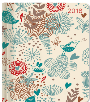
Agenda settimanale Ladytimer 2018 „Birds“ 10,7x15,2 cm